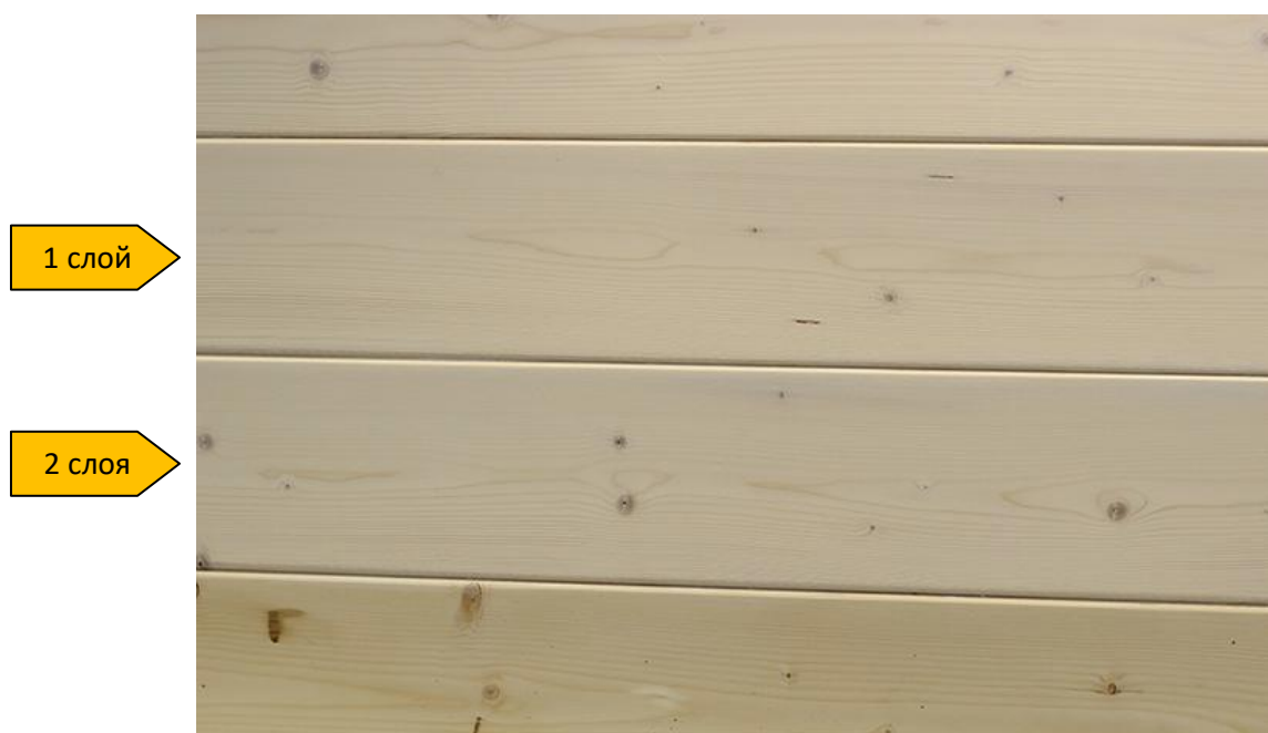
образцы с однослойным и двухслойным нанесением Terra Wax-Oil

Adler Terra Wax-Oil (арт. 703600020002) можно применять в системе с Lignovit Primo (арт 535800020004). Оттенки Adler Terra Wax-Oil см.на сайте www.adler-lacke.ru